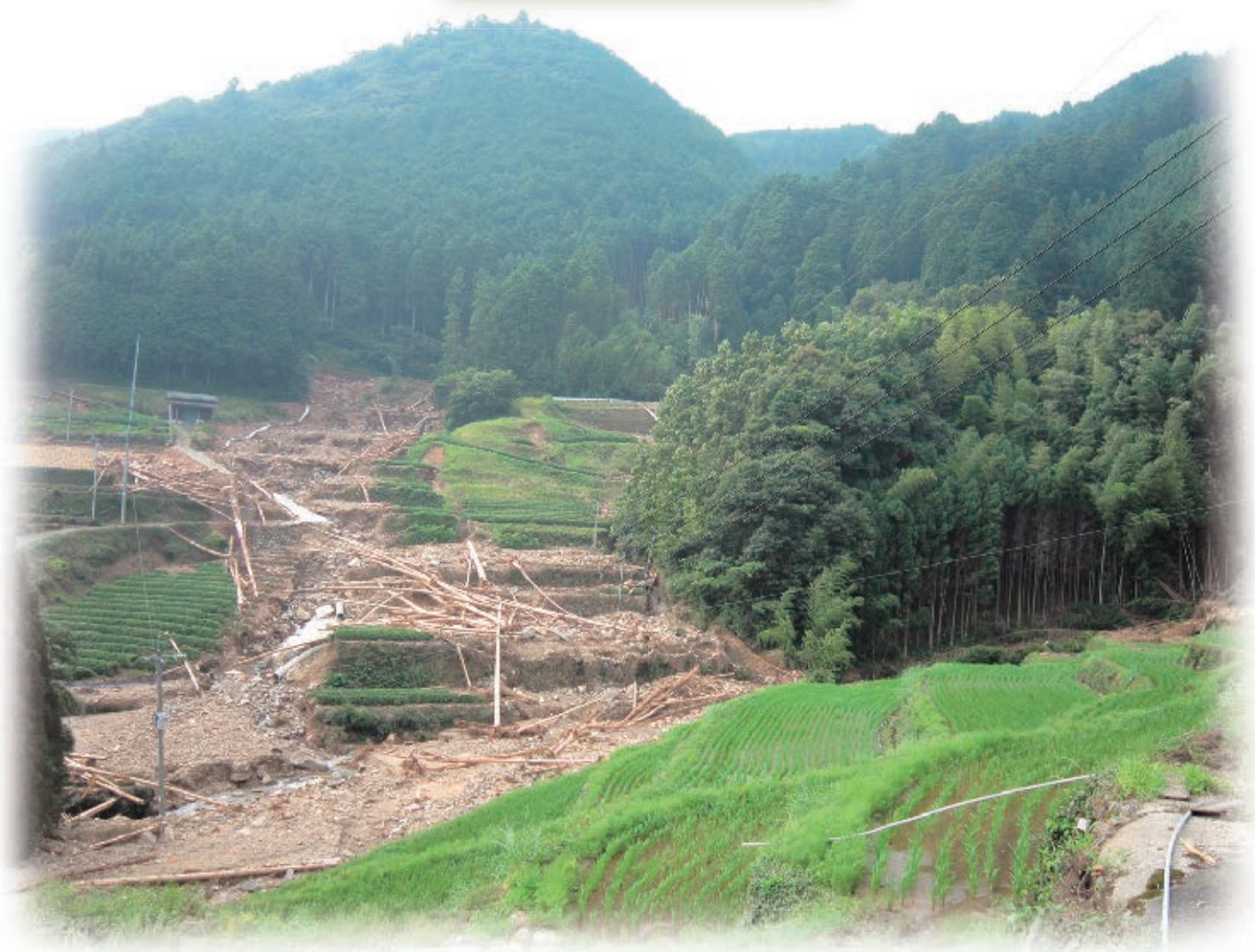
九州北部豪雨時の下松尾地区(八女市黒木町)