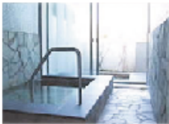
和風家族風呂(かえて)内風呂と、露天風呂とあり。