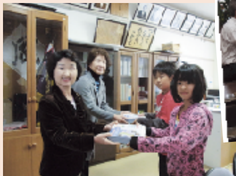
11月10日(木) 筑後市立古川小学校 118枚