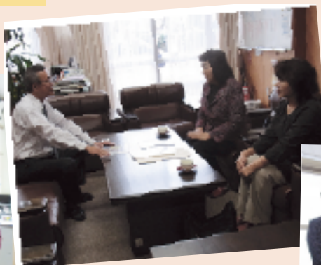
11月11日(金) 広川町立中広川小学校 753枚