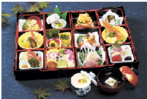
配達用 松花堂弁当

婚礼に関する儀式及び物品販売等 大小宴会、パーティ、会合、展示会、 催事、仕出しの企画運営管理に関する事業