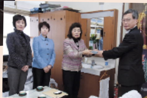
1月25日(水) 八女市立川崎小学校 112枚