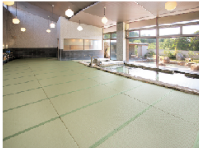
大浴場「しゃくなげ」

浴槽は、ヒノキを使った大浴場と、季節風呂、水風呂の3つで、他に景色を見ながら入れる高温サウナがあります。大浴場の洗い場は全面畳敷きとなっていて、寝転がっても、転んでも大丈夫。お年寄りにも安心してご利用いただけます。