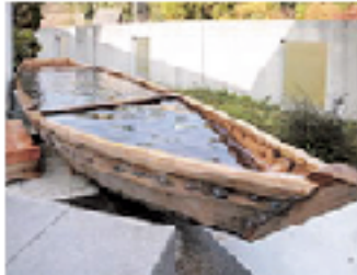
あじさいの露天風呂の「湯舟」