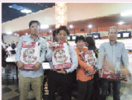
1日目優勝 クロレラ工業