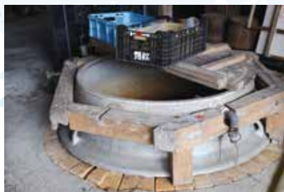
かつて3台あったという、アルミの釜。いまは使用していない。