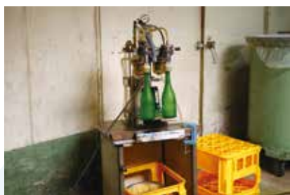
瓶詰め用の機械。右隣の写真は、料理酒などのバック用充填機。