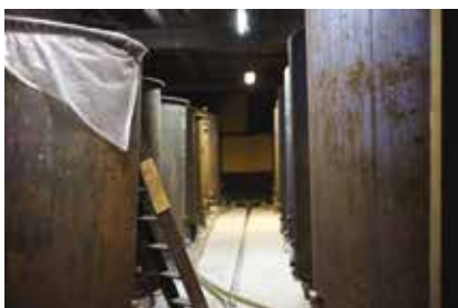
薄暗くひんやりとした貯蔵庫。ここには、普通酒と本醸造が眠っている。