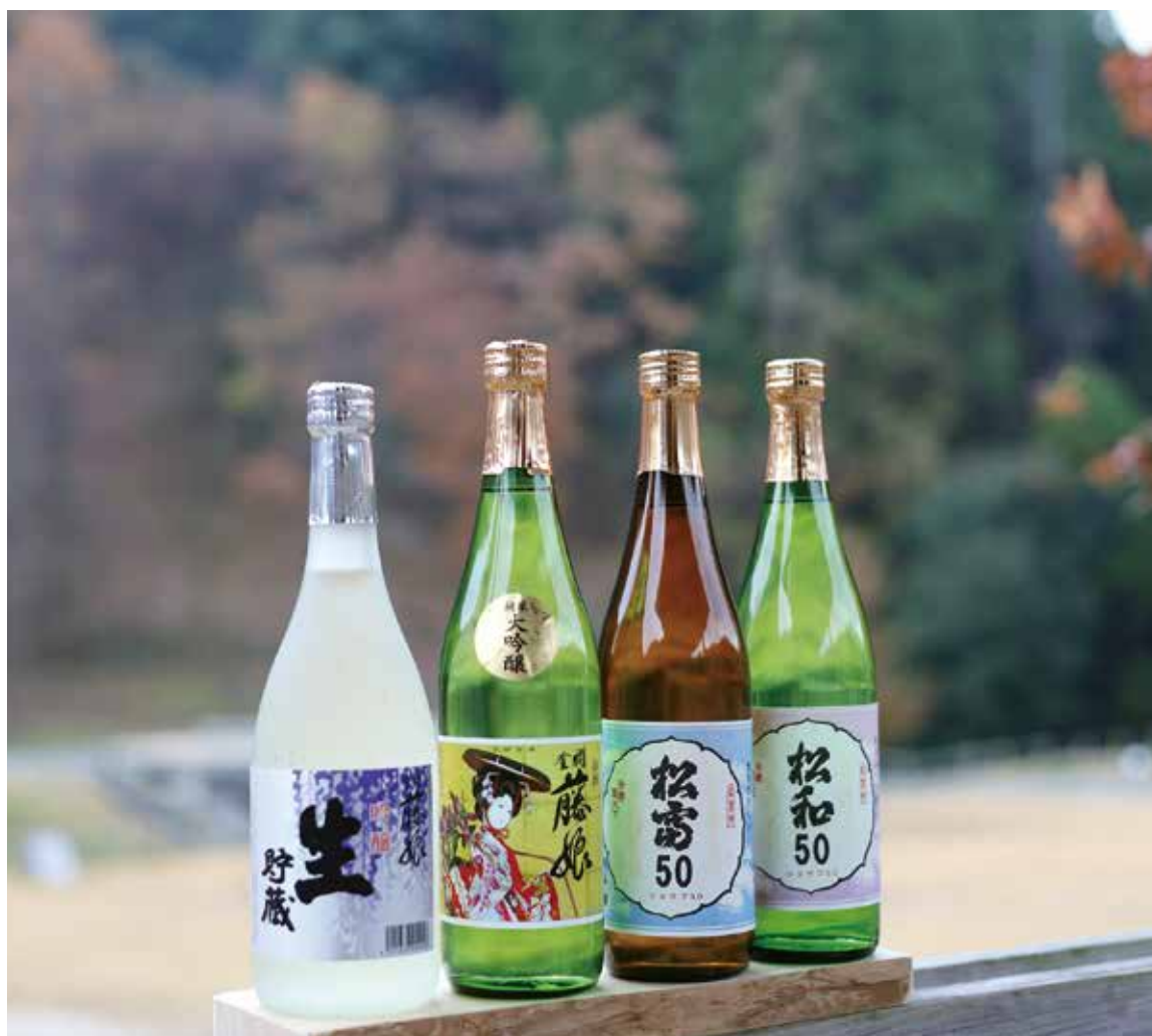
左から、「金欄 藤娘 吟醸 生貯蔵」「金欄 藤娘 純米 大吟醸 50」／ともに、後藤酒造場 「旭松大吟醸 松富 50」「旭松純米大吟醸酒 松和 50」(ともに、旭松酒造)