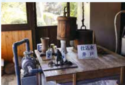
奥八女の地下水はやわらかくて扱いにくい、酒をまろやかにする。