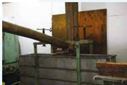
てこの原理を使う、はねぎ搾り。100kg ほどの巨木を使っている。