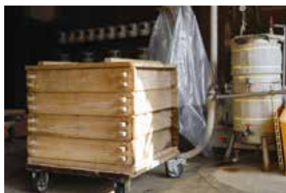
蒸籠で米を蒸すのは難しいが、蒸米の仕上がりがやわらかい。