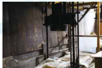
昭和9年から使い続けている槽(ふね)。槽搾りは手間だが雑味が出にくい。