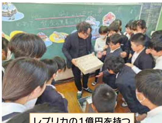
レプリカの1億円を持つ