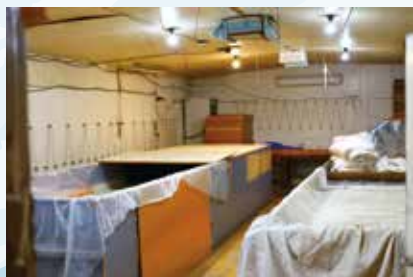
30 度くらいに保たれた麴室。温度管理は壁の温床線で行う。