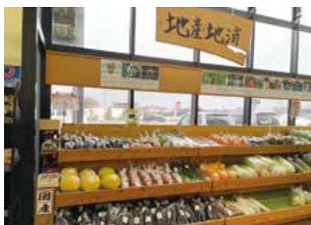
地産地消コーナー

生鮮食品から生活必需品、衣類やキッチン用品まで。 日々の生活必需品をそろえて皆様をお待ちしております