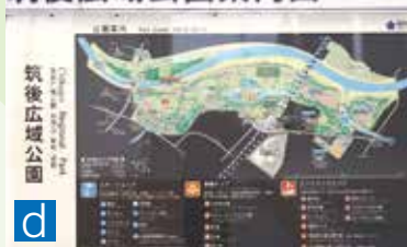
筑後広域公園案内図