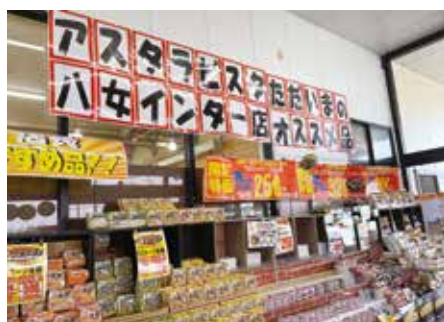
オススメコーナー