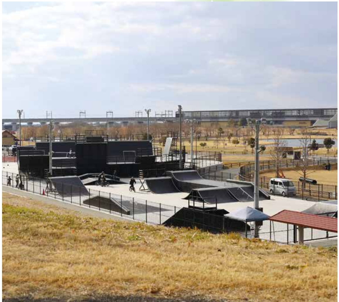
ナイター照明を完備、大会も可能なBMXパーク(筑後広域公園)