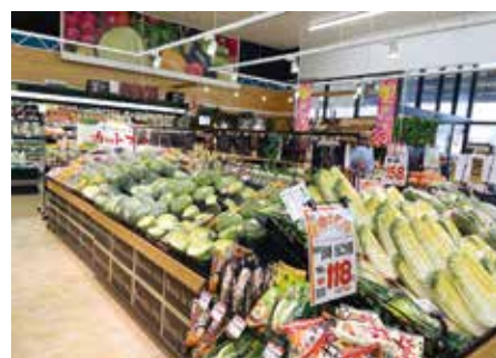
生鮮食品コーナー